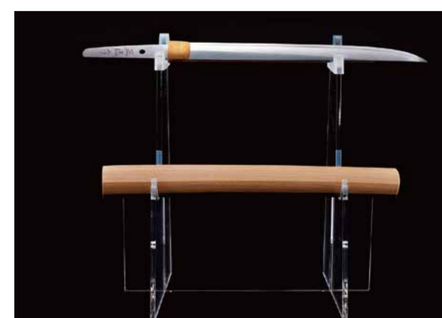
宇部工業産の鉄を使用した刀