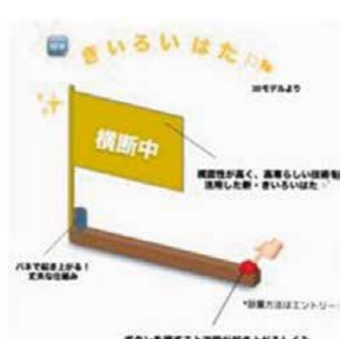
現代版きいろ横断旗