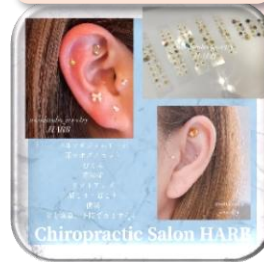
Chiropractic Salon HARB