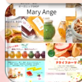
Organic Shop Maryange