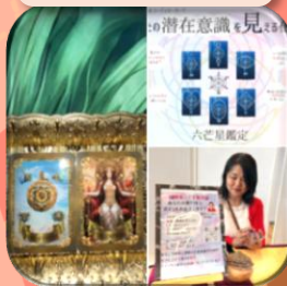
幸せライフ コンダクター