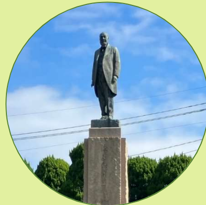
渡邊 祐策 像