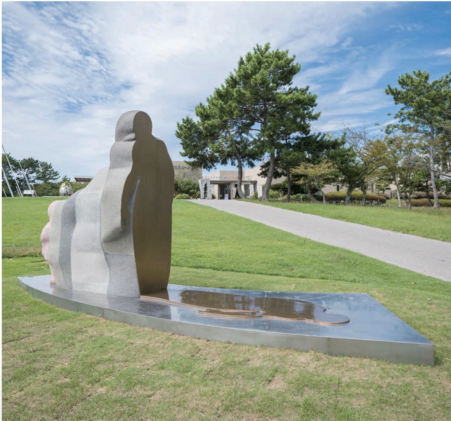
Inflating Shadow(インフレイティング シャドウ) 第29回UBEビエンナーレ(現代日本彫刻展)柳原義達賞 2022 *UBEビエンナーレ彫刻の丘に展示