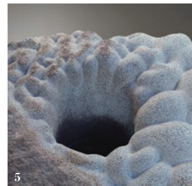
1.Plants(2021) 2.融解(2023) 3.Repeated(2022) 4.呼吸する(2019) 5.融解する境域(2024)