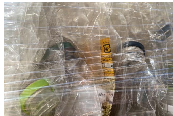
現行では手選別で除去していたラベル付きペットボトル