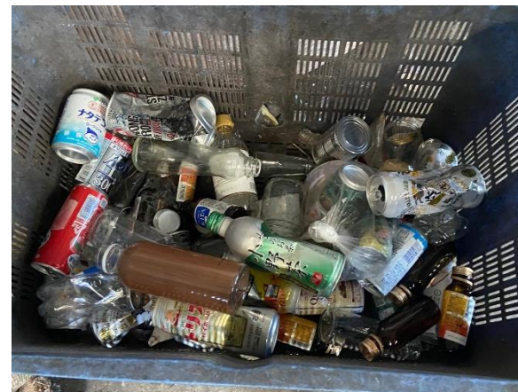
手選別で除去した異物