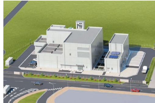
玉川ポンプ場完成予想図