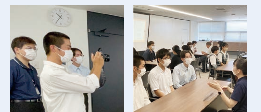
おしごと体験 若手職員とのフリートーク

9月には大学生を対象に開催し、一人でも多くの若い世代のみなさんに市役所の仕事に興味を持ってもらえるよう、引き続きPRをしていきます。