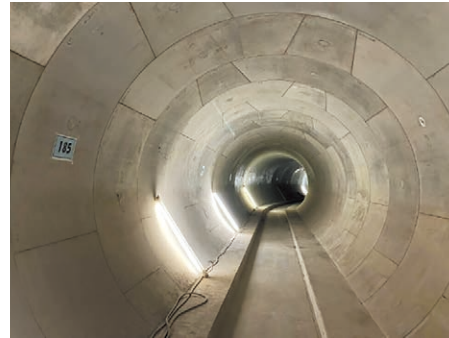
地下13mの下水道管(直径3.5m)