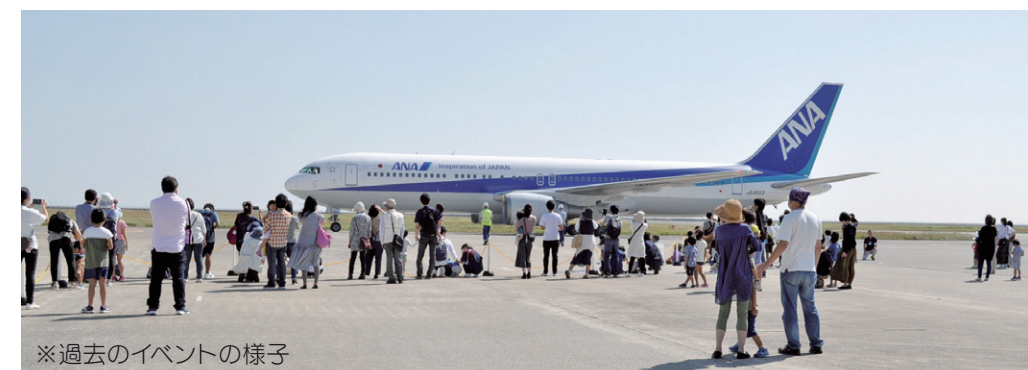
※過去のイベントの様子

申込み 9月14日(木)までに、往復はがき(当日消印有効)でお申し込みください。 ※応募はイベント毎に一人一口まで(応募者多数の場合、抽選) ※一口あたりの申し込み人数は5人まで