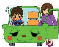
飲酒運転の車に同乗した人