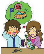
車に乗って来た人にお酒を提供した人