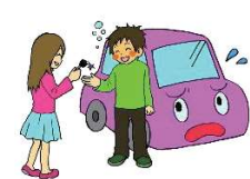
お酒を飲んだ人に車を貸した人