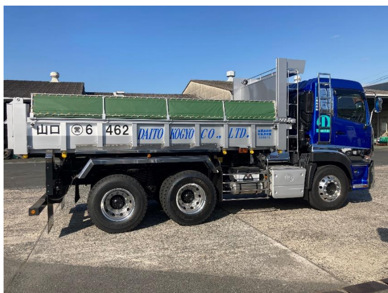
補助金等利用しての重機入れ替え