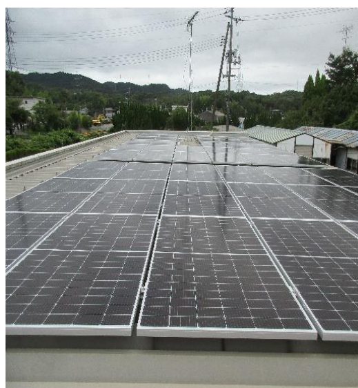
事務所 太陽光パネル設置