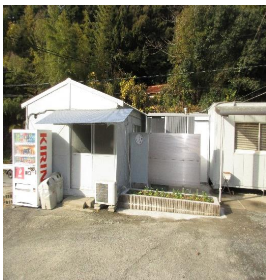
嘉川工場 トイレ新設

また、女性従業員が増加したこともあり、職場環境の改善や教育にも取り組んでいます。