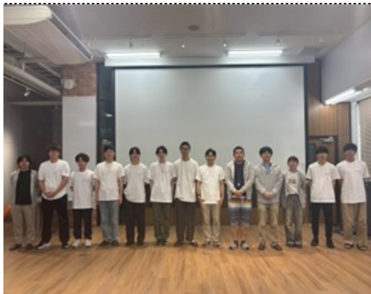
山口大学工学部学生アルバイト多数在籍

コンピューターによる土木構造物の数値解析を主に行っている会社です。 複雑な地盤の挙動を数値解析で再現することによって、トンネルをはじめ土木に関わる全ての方に安心・安全を提供することが我々の役目です。 世界に貢献する技術者集団になることを目指しています。