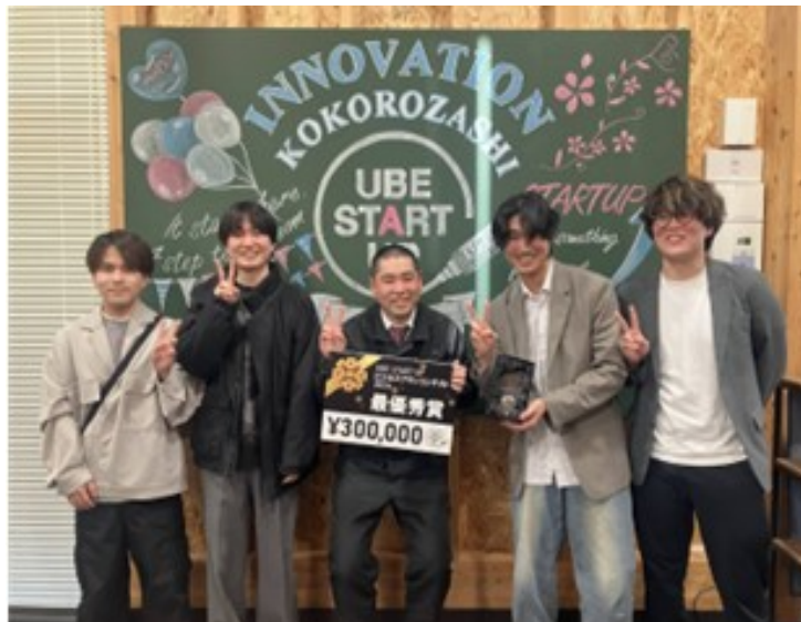
UBE STARTUP ビジネスプランコンテスト2024 最優秀賞受賞

男女雇用機会を平等にし、産休・育休、時短勤務など働きやすい環境づくりの推進に取り組んでいます。社員のライフスタイルに合わせて、フレックスタイム制を導入しています。アプリ開発により業務の効率化やビジネスモデルの変革に取り組んでいます。