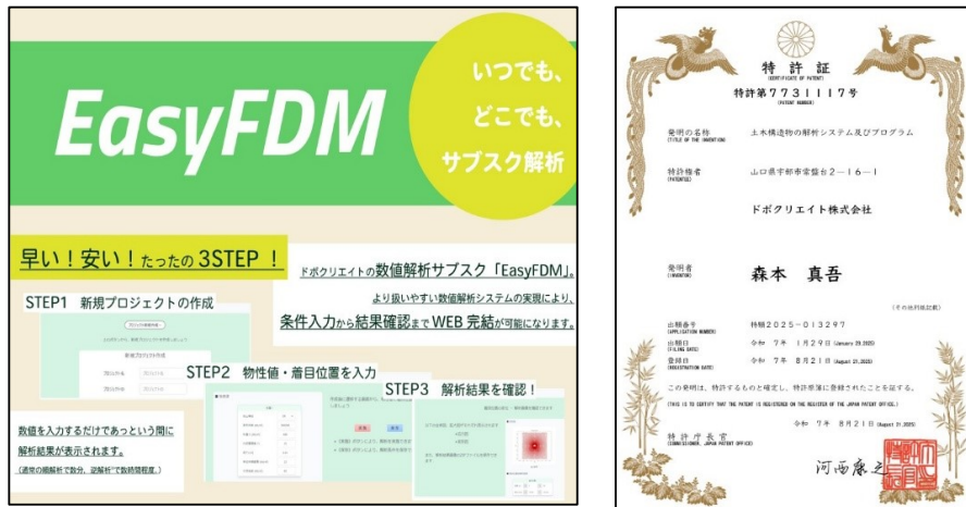
数値解析自動化システム「EasyFDM」が特許を取得