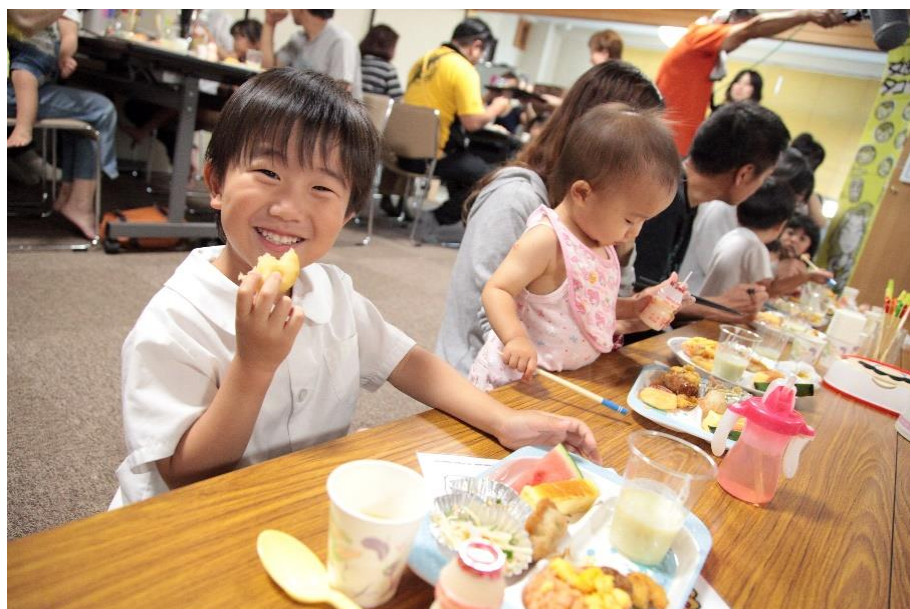
地域食堂「みんなや食堂」の風景

「持続可能な社会」実現の重要性を、企業活動を通して社員ひとりひとりが自覚し、社内が一丸となってSDGsの達成を目指します。