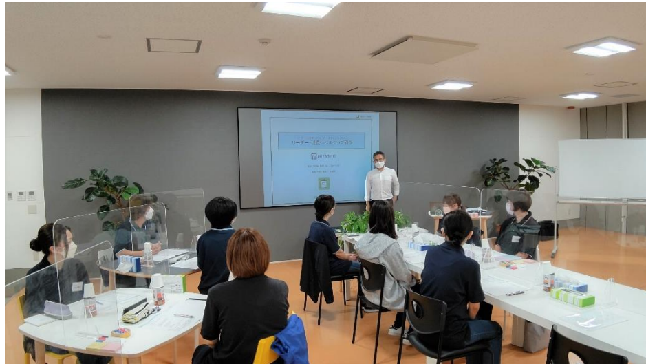
女性管理職へのリーダーシップ研修