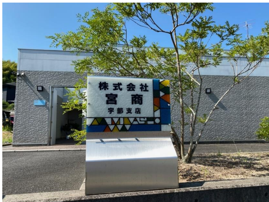
株式会社宮商 宇部支店

商社部門では、国産のセメント商材の他、タイ産天然石膏を扱っています。加工作業部門では、半導体原料の製造工程の中でも、熟練した作業者の手作業が必須とされている破碎工程のみを取り扱う、非常にニッチな業務を行っています。