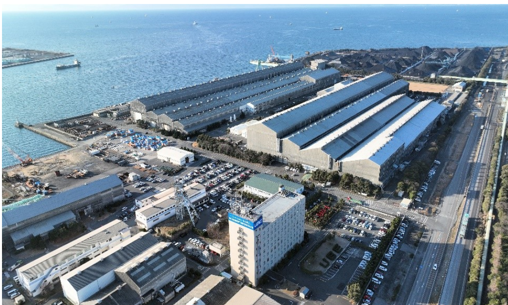
2つの工場を構えるUBEマシナリー株式会社 宇部本社

「女性管理職の比率増加」に向けては、性別や世代を問わずに誰もが働きやすい職場環境づくりを推進することで、2030年度には現状（1.6%）の約2倍となる3.0%達成を目指します。