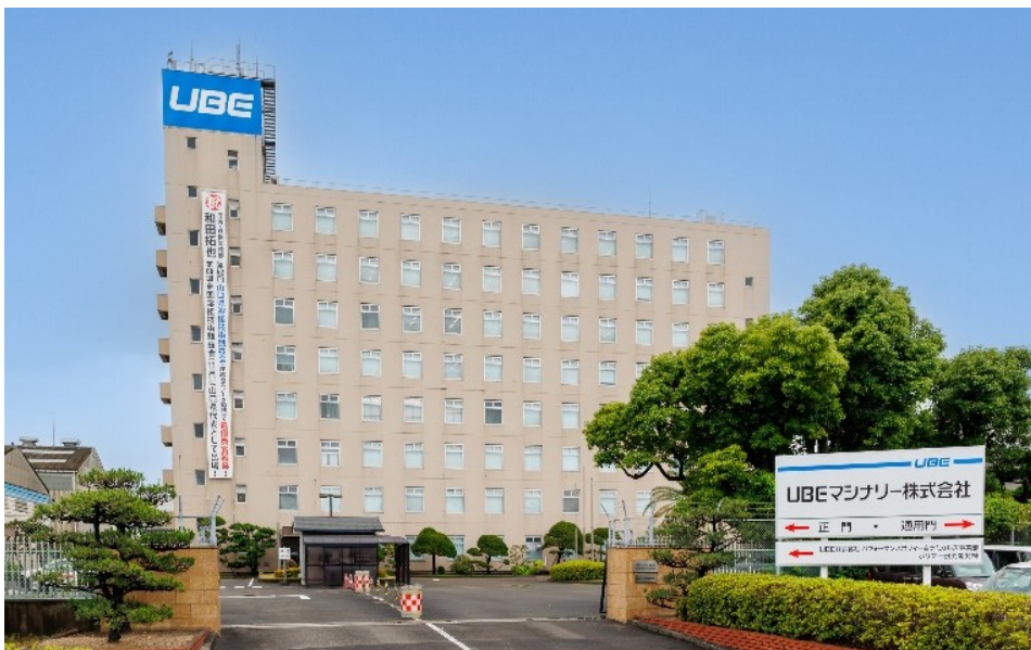
UBEマシナリー株式会社 宇部本社本館

製品には、アルミを材料に自動車用エンジン等を成形する「ダイカストマシン」、窓用アルミサッシ等を作る「押出プレス」、樹脂を材料に自動車や家電材を成形する「射出成形機」、セメント設備に欠かせない「窯業機」「粉碎機」、発電所等で活躍する「運搬機」「除塵機」のほか、化学プラントを構成する「化学機器」、鋼橋など大型溶接構造物を手掛けています。