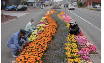
フラワーロード東岐波のみなさん

令和3年度に実施した市政懇談会において、若い世代や働く世代の地域活動への参加者が少ないこと、自治会や子ども会の加入率が低下しているとの意見を多くいただきました。大規模災害などの緊急時では、地域や地域住民同士のつながりにより、被害を未然に防げた事例もあります。