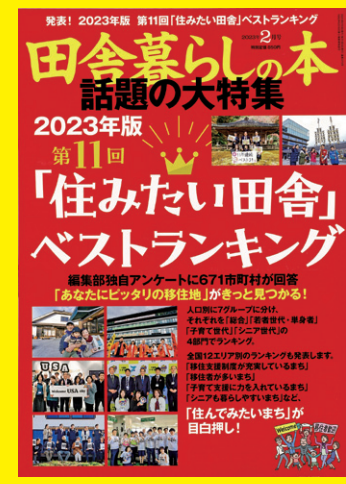
宝島社『田舎暮らしの本』2023年2月号 「2023年版住みたい田舎ベストランキング」

株式会社が発行する地方移住を希望する人のための月刊誌「田舎暮らしの本」の「住みたい田舎ベストランキング」「人口10万人以上20万人未満のまち」総合部門で、宇部市が第3位に選ばれました。宇部市では、移住定住の推進に全力で取り組んでいます。昨年度の県