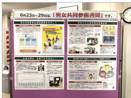
フォーユー（1階ロビー）でのパネル展示