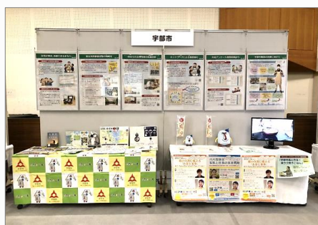
会場後方の展示ブースで市の取組をPR