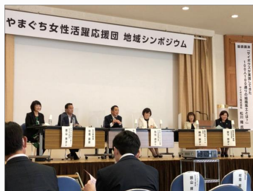
知事・市長を交えたパネルディスカッション