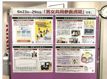
フォーユー（1階ロビー）でのパネル展示