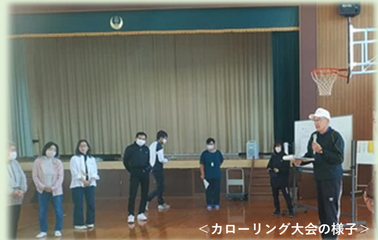
<カローリング大会の様子>

多世代との交流が自身の元気の源となり、日々地域活動に取り組まれています。また、地域の子どもを育てることが、将来の地域活性化につながると考え、自身の活動を地道に続けながら、地域活動の大切さを広め、少しずつでも参加者が増えることを願い活動をされています。