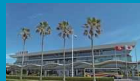
スカイブルー(広い空、キワ・ラ・ビーチのイメージ)

R0 G167 B225 C80 M18 Y9 K0 #00A7E1 PANTONE 2995 C 近似色 : DIC 100