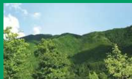
マウンテングリーン(霜降山、茶畑、若々しい緑のイメージ)

R0 G172 B105 C93 M0 Y78 K0 #00AC69 PANTONE 3405 C 近似色 : DIC 174