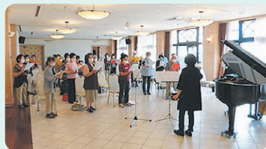
高齢者の生きがいづくりの場