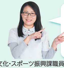
文化・スポーツ振興課職員

地域の学校やスポーツ施設などを拠点に、子どもから高齢者まで幅広い世代の方が様々なプログラム(スポーツ活動や文化活動)を気軽に楽しむことができるクラブです。