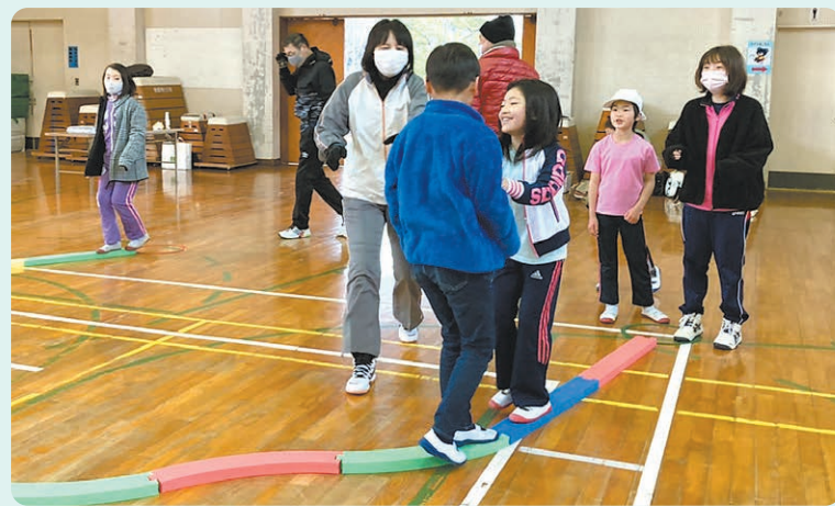
親子で参加OK! 世代を超えた交流