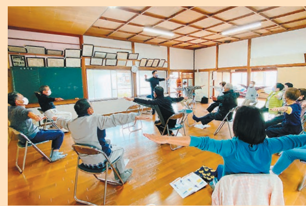
山村後いきいきサロン(西岐波)での体操の様子

近所で気軽に集い、見守りや社会参加を目的としたサロン(通いの場)。地域の方々が運営するサロンで新たに健康づくりの専門家によるサポートプログラムを始めます。サロンを新しく作りたい方、今あるサロンを充実したい方は、ぜひご活用ください。