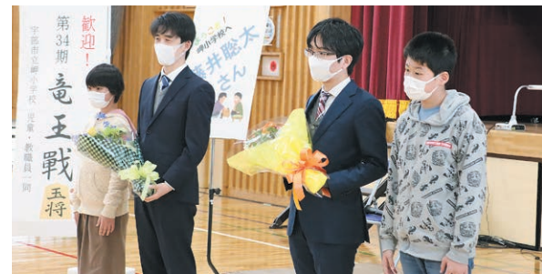
岬小学校のこどもたちと