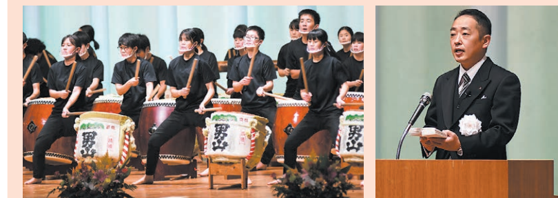
オープニング 厚東川中学校夢太鼓 市長式辞