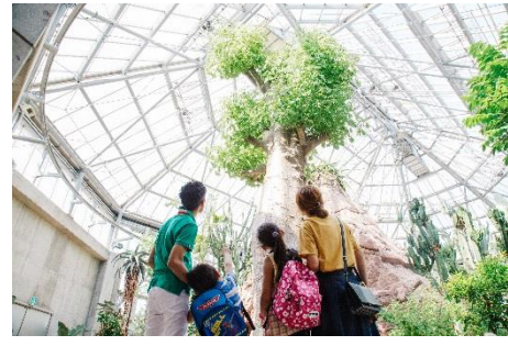
世界を旅する植物館