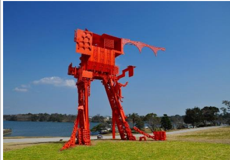
UBE ビエンナーレ彫刻の丘