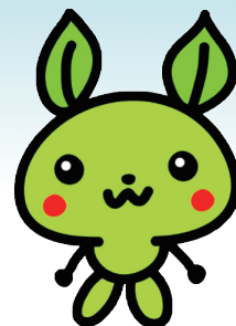
宇部市環境イメージキャラクター 「エコハちゃん」