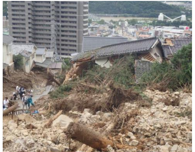
広島県安佐南区 八木地区