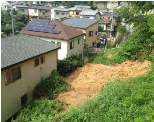
広島県安佐南区 山本地区