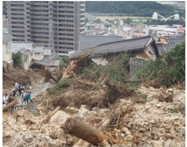
広島県安佐南区 八木地区