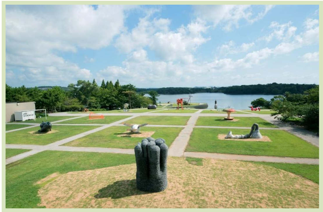
U B E ビエンナーレ