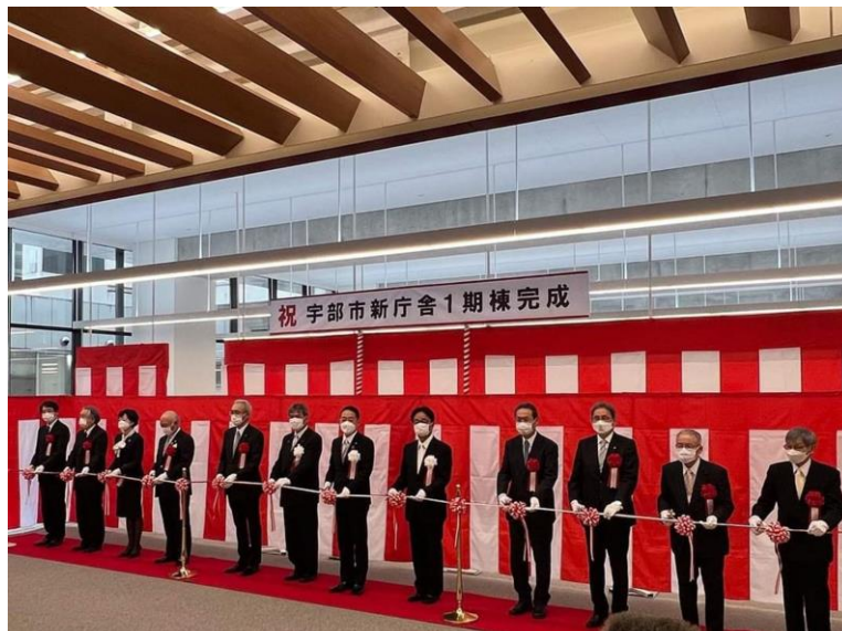
▲完成式典で行われたテープカットの様様