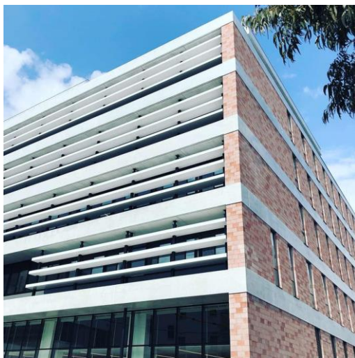
▲桃色レンガをイメージした外観