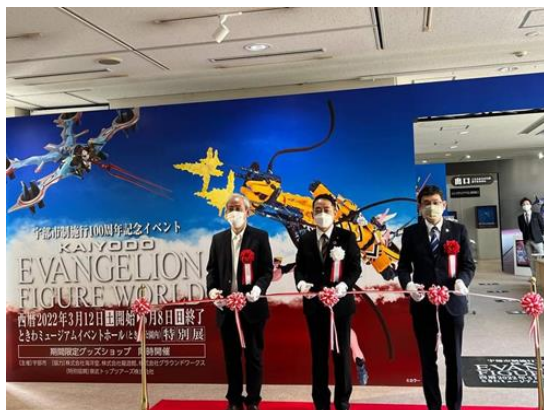
▲「海洋堂エヴァンゲリオンフィギュアワールド」オープニングセレモニーの様