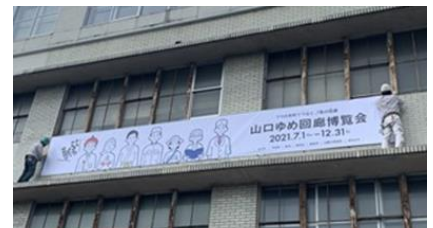
▲5月17日（月曜日）に市役所本庁舎に

この博覧会は、山口県央連携都市圏域（山口市、宇部市、萩市、防府市、美祢市、山陽小野田市、島根県津和野町）で行われる多様なイベントの集合体です。あわせて伝統・文化や自然、食などを紹介し、圏域の魅力を全国に発信します。