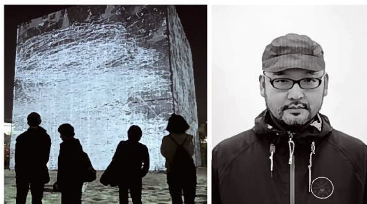
『UbeCube1.0』 ※画像は過去の作品イメージです

キューブ状の構築物を中心に、芝生広場全体に美しい映像が次々と映し出されます。映像の中には、宇部市ならではのモチーフもたくさん。まるで万華鏡の中にいるような、光と音に包まれる幻想的な時間をゆっくりお過ごしください。