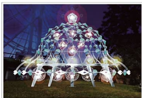
Close Encounter 369