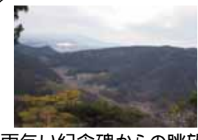
雨乞い記念碑からの眺望

大神岩の上からは、 東西鳳翔山、平原岳、 阿知須きららドーム、 姫島が見渡せます。