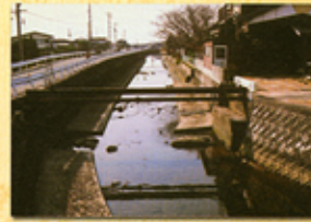
24 梅田川妻崎樋門跡