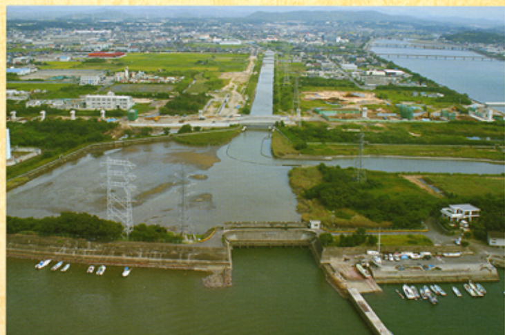
(小島樋門から中川、厚南平野を望む)