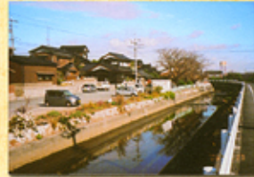
22 旧妻崎漁港、魚市場跡