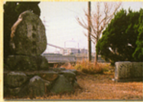
28 小島樋門改修記念碑