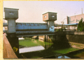
25 梅田川防潮水門と排水機場