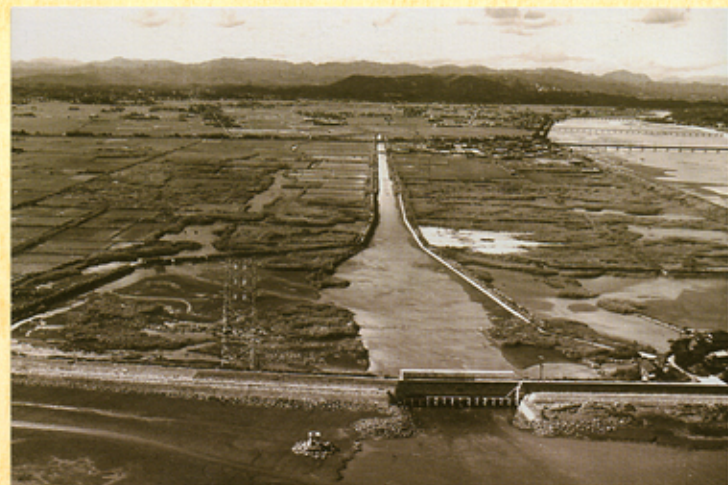
(昭和34年8月、樋門改修直後)