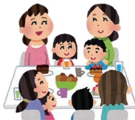
おお にん すう ちょう じ かん いん しよく 大人数や長時間の飲食