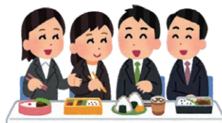
い ば しよ き か 居場所の切り替わり きゅうけいしつ きつ えん じよ (休憩室や喫煙所など)