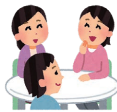
かい わ マスクなしでの会話