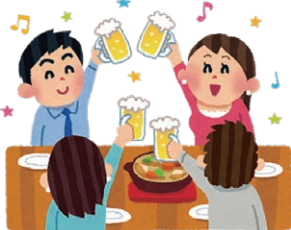
いん しゅ ともな こん しん かい 飲酒を伴う懇親会

これまでの感染拡大の経験から、感染リスクが高い行動や場面が明らかになってきました。これらの場面を避けて生活をしましょう。