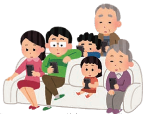
かん き せま へや 換気のない狭い部屋での きょうどうせいかつ 共同生活