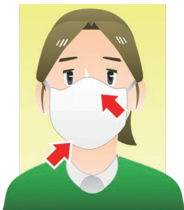
ちやくよう マスクを着用する