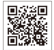
スリッパ卓球フェイスブック