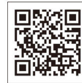
スリッパ卓球サイト

問い合わせ先／湯田温泉スリッパ卓球大会実行委員会 ☎083-925-6843 FAX083-925-6851