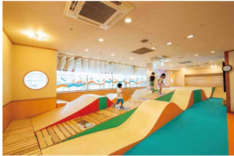
コロガルあそびのひゃっかてん会場の様子

問い合わせ先／山口情報芸術センター[YCAM] ☎083-901-2222 🌐 https://www.ycam.jp/