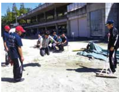
陸上競技場ではスポチャレ祭2016を開催し、ニュースポーツの体験や体力測定などを実施しました。