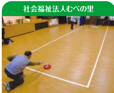
社会福祉法人むべの里

「腰痛・膝痛予防の健康教室」「成長期に必要な体幹トレーニング」「体幹ヨガ教室」を開催しました。