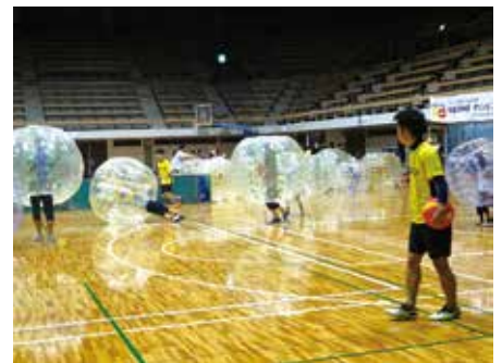
依田翁記念体育館では、車いすバスケットボールやバブルサッカーの体験会などを実施し、普段スポーツをしない人・苦手な人でも楽しめるスポーツ体験会を実施しました。