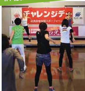
オープニングイベント やまぐち元気ラジオ体操& スローエアロビック