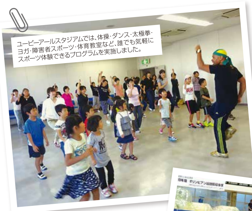
ユージーアールスタジアムでは、体操・ダンス・太極拳・ヨガ・障害者スポーツ・体育教室など、誰でも気軽にスポーツ体験できるプログラムを実施しました。

10月10日(月・祝)体育の日に「スポーツコミッションフェスタwithうべ歩き愛です」を宇部市恩田運動公園一帯で開催しました。天候にも恵まれ、絶好のスポーツ日和となりました。当日はフェスタ全体で2000名の来場者が訪れ、大盛況のイベントとなりました。体育の日にふさわしく、思い思いに様々なスポーツを楽しまれている姿をたくさん見ることが出来ました。