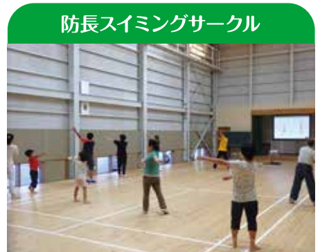
防長スイミングサークル

1月22日(日)にみんなの里ららら会館にてカローリング未経験者を中心に、誰でもできるNewスポーツとして開催しました。