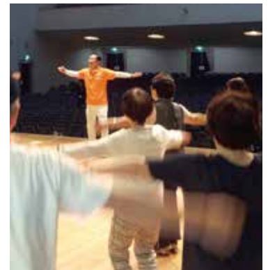
バックヤードツアーとラジオ体操を 組み合わせた心と身体の 健康イベント等実施