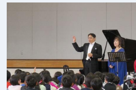
子ども夢教室（声楽）

地域文化の伝承者や芸術家、さらには文化活動をサポートする幅広い人材を育成・確保するとともに、将来を担う子どもたちが、ふるさとへの誇りや愛着心を抱くことができるよう、本市の歴史や文化、地域資源を学ぶ機会を増やします。