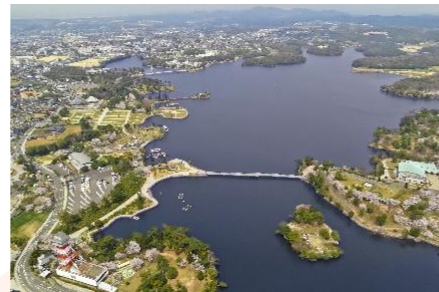
ときわ公園 世界かんがい遺産 に登録された「常盤湖」

本市の文化資源を活用したイベントの開催や、市民の文化活動への参加を通じて、活気とにぎわいのあるまちづくりを進めるとともに、市独自の文化財産を観光・交流資源として有効活用し、交流人口の増加に取り組みます。