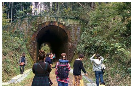
うべの里アートフェスタ （旧船木鉄道 大榎トンネル）

UBEビエンナーレを核として、うべの里アートフェスタやまちなかアートフェスタ、宇部市芸術祭に、宇部の「食（グルメ）」の要素も加え、市内全域で魅力的なイベントの創出に取り組みます。