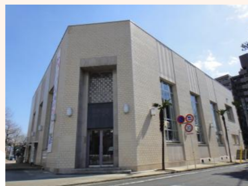
村野藤吾設計 ヒストリア宇部 （旧宇部銀行館）

「ときわ公園活性化基本計画」に基づき、日本一の「自然体感テーマパーク」を目指し、市民の憩いの場のさらなる充実とともに、文化の振興と観光施設としての魅力のグレードアップを図ります。