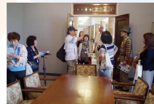
文化財や宇部の歴史に関する ボランティアガイド

歴史と伝統の中から生まれ、守り伝えられてきた文化を、将来にわたって確実に継承し、発展させていくための活動を支援するとともに、次世代を担う子どもたちが、歴史・伝統・文化に対する関心や理解を深め、尊重する態度を育てることにより、豊かな人間性を養います。