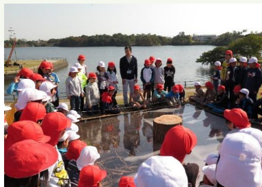
UBEビエンナーレ 小学生の彫刻鑑賞授業