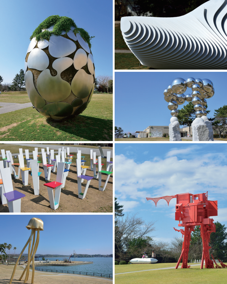
野外雕刻國際競賽