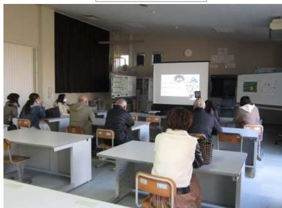
密を避けて保護者や地域の方は別室で視聴