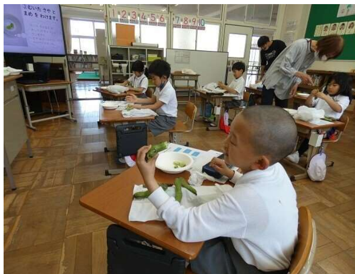
5月19日（金） 地域の方とグランドゴルフ 24日（水） そら豆の皮むき 二俣瀬小学校

二俣瀬小学校では、クラブ活動で地域の方とグランドゴルフを一緒に行いました。また、24日には地域の方からたくさんのそら豆をいただき、栄養教諭の話を聞きながら1、2年生がさやむきを体験しました。むいた豆は塩ゆでされ、翌日の給食で全校児童、職員で味わいました。そら豆が苦手な児童も、自分たちでむいた豆をおいしそうに食べていました。