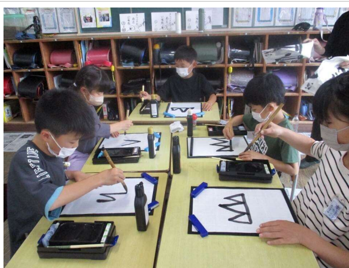
5月16日（火） 最初の毛筆学習はプロの指導で 東岐波小学校

小学校では3年生から毛筆の学習が始まります。東岐波小学校では、毎年、ふれあいセンターで書道教室を開いておられる玄遊会の先生方に指導をしてもらっています。初めて筆を握るこの日は、準備の仕方や道具の使い方、字を書く時の約束など、丁寧に教えていただきました。最後には、「二」を清書することができました。