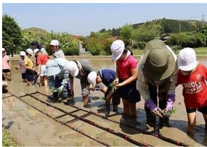
5月17日（水） 放課後子ども教室との協働で稲作 吉部小学校

吉部小学校は、「放課後子ども教室」との協働で、稲作に取り組んでいます。この日は、昔懐かしい「田植え定規」を使って、苗を一定間隔に並ぶように植えていきました。地域の方々は開始の一時間半前から準備をしてくださいました。また、山口大学の学生も一緒に活動し、スムーズに苗を植えることができました。豊かな自然に恵まれ寒暖の差が大きい吉部地区の米は、地域自慢の農作物です。稲作体験を通して、ふるさと吉部を愛する心を育てていきます。