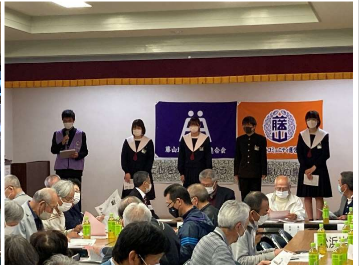
4月28日（金） ヤング自治会が地区自治会連合会総会で説明 藤山中学校

藤山中学校では、生徒が地域の一員として自覚し、地域に貢献できる人材として育成することを目的とする「ヤング自治会」という取組を行っています。全校生徒が13のグループに分かれ、総合的な学習の時間として、自治会集会を開き話し合いを行っています。これまでに地域清掃や地域行事への参加を行ってきました。今年は、地域にある公園を誰もが使いやすい公園にしていこうと目指す「地域の公園魅力向上プロジェクト」を進めていきます。この日は、藤山地区の自治会連合会総会があり、代表生徒が取組の説明を行いました。日常的な地域貢献を進める大変素晴らしい取組です。