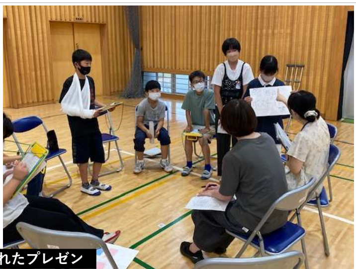
本日の熟議の総合的な学習の中での位置づけが示されたプレゼン