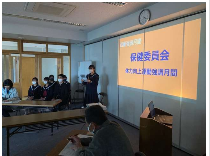
4月17日（月） 学校運営協議会での熟議結果を生徒がプロジェクト化 厚東川中学校

本年度最初の学運協で、生徒会役員が本年度の本年度の説明がありました。厚東川中学校では、昨年度、6月の生徒総会、2月の中学校区合同学運協で「中学校区をもっとよくするには」というテーマで熟議を重ねてきました。その後、生徒会で協議が重ねられ、本日、「あいさつ大使プロジェクト」など6つのプロジェクトとして報告されました。さらに、生徒会の各委員会では実現に向けて、重点取組月間など具体的に行動する計画も発表されました。年度最初の段階で、ここまで具体的な計画が示されていることは大変素晴らしいと思います。今後の取組に大いに期待しています。