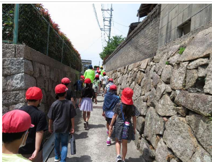
5月2日（火） 第3回校区探検 原小学校

原小学校では、3年生が総合的な学習の時間で校区の探検をしています。自分たちの住んでいる地域の魅力、学校の地理的な特徴、校区内の産業の特徴などを実際に歩いて確認しています。これまでの2回で、ふれあいセンター、市民センター、郵便局、妻崎駅、スーパー、梅田川に行き、3回目の本日は長門長沢駅、水神社、コンビニ、西宝寺に行きました。探検には、地域の方も加わっていただき、交通マナーや地域のことを教えていただきました。