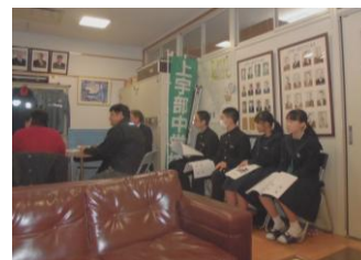
【生徒がよりよい学校づくりの主体となる貴重な機会となりました。】

委員の方からも、今後の熟議してほしい課題や地域づくりと運営協議会のかかわりについて貴重な意見が出されました。地域とともにある学校づくりが着実に進んでいることをすばらしいと思いました。