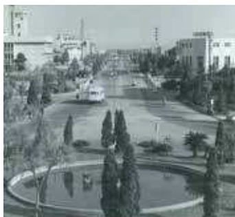
戦後間もない頃の 常盤通り

宇部市は、第二次世界大戦中、空襲により市街地のほとんどを焼失しました。しかし、その後の復興計画は、他の都市より早く、しかも大胆に進められました。戦後早い時期に街路の緑化を図ったことは、全国的に注目されました。