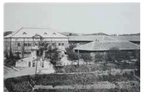
宇部中学校 (大正15年刊「宇部市写真帳」うべ歴史読本より)