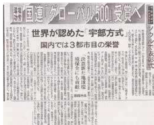
宇部時報 1997（平成9）年5月2日