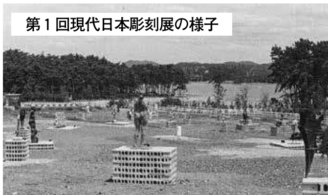
第1回現代日本彫刻展の様子

宇部市を象徴するものの1つに「彫刻」があります。宇部市には、約360点の彫刻があります。そのうち、約半数は彫刻展の開催される常盤公園に、残り半数が市街地に展示されています。都市の景観をよくしたり、生活する場所で芸術を鑑賞したりといった「うるおいのあるまちづくり」に加え、これまでおよそ50年におよぶ彫刻展の積み重ねによって、まち全体が野外彫刻の美術館となっていると言えます。