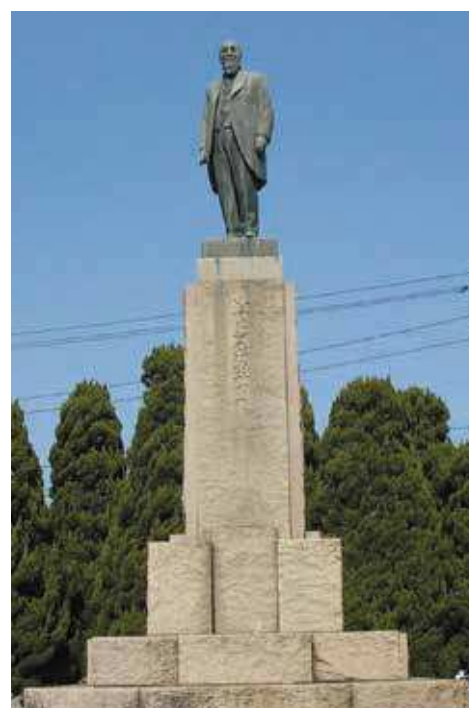
朝倉 文夫 作

したほか、 1922（大正11）年には第1回宇部市議会議員選挙で当選、初代議長に就任しています。当時は、国会議員と地方議員の兼務が可能だったとはいえ、旺盛な行動力には驚かされます。