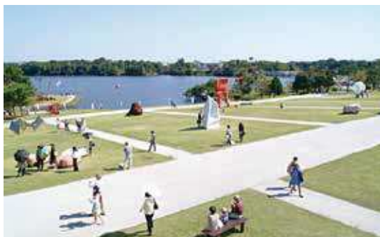
第25回UBEビエンナーレの様子

その後、1968（昭和43）年に神戸市の「神戸須磨離宮公園現代彫刻展」がスタートし、1969（昭和44）年に神奈川県箱根町の彫刻の森美術館が開館しました。宇部市を含めて、後に「日本の三大野外彫刻展」と呼ばれる展覧会がこの時代に出そろいました。こうした日本全体での広がりの中で、先進的な宇部市の取り組みは高く評価されています。現在では、2年に1度、「UBEビエンナーレ」が開催され、世界中から注目されています。