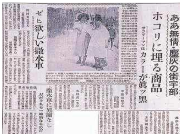
当時の新聞記事（昭和25年6月）

サルにハナ毛があるなしはともかく、宇部市宮大路動物園のサルに結核が集団発生し、死んだサルの大半がじん肺症だったことは事実だったようです。宮大路動物園は、1960（昭和30）年に開園された宇部市の都心部にある小規模な動物園でした。調査の結果、1965（昭和35）年までの5カ年に、67匹のサルのうち19匹（28%）が死にました。そのうち、15匹（80%）がじん肺症でした。その後、この動物園は郊外のときわ公園に移転しました。宇部市の大気汚染のすごさを物語っていると言えるでしょう。