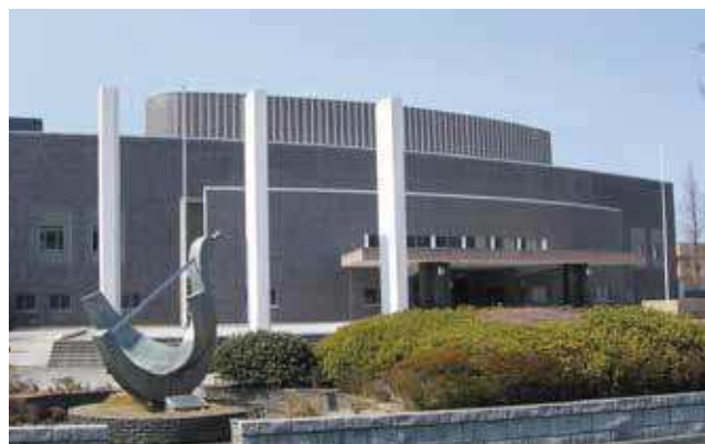
村野 藤吾 作