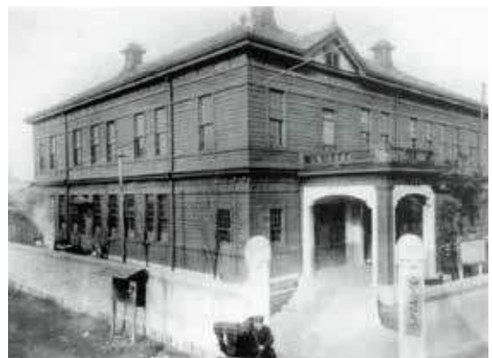
1920（大正9）年に建てられた 木造2階建ての沖ノ山同仁病院 (「市制記念写真帳」うべ歴史読本より)