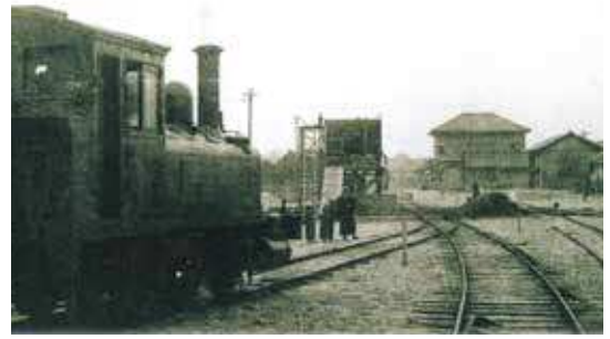
新川駅構内の宇部軽便鉄道の機関車

さらに、1914（大正3）年には沖ノ山炭鉱医局（その後の沖ノ山同仁病院）が開局しました。