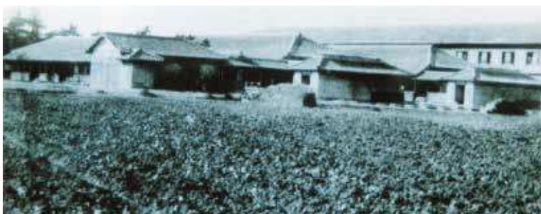
創立当時の新川小学校 (絵葉書「宇部百景」うべ歴史読本より)