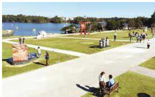
第26回UBEビエンナーレの様子