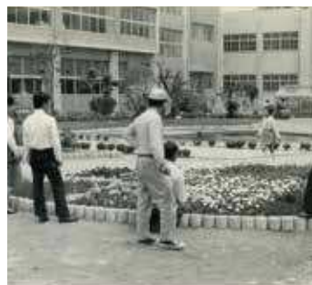
1960年代の 花壇コンクールの審査風景

このような街路樹の整備と並行して、真締川河畔や渡辺翁記念会館前広場の植樹や市内各所の公園整備が進みました。