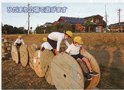
ひだまり広場で遊びます