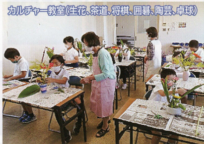
カルチャー教室(生花、茶道、将棋、囲碁、陶芸、卓球)