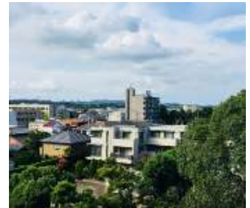
ふれあい教室からの風景