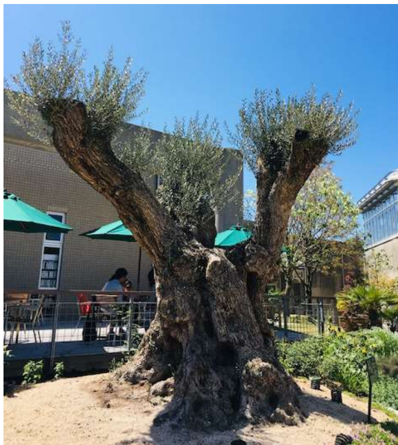
ときわミュージアム「世界を旅する植物園」オリーブの木