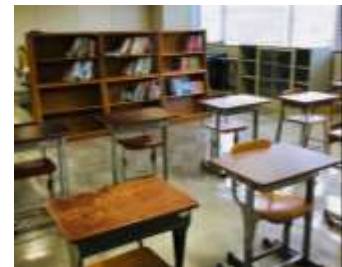
ふれあい教室～学習室