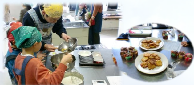
「パパとお菓子づくり」講習会

同じ子育て中の男性と交流してみませんか？市内に在住・勤務している男性なら誰でも参加OK。会から子育て情報メール「イクメン通信」を配信するほか、交流会や育児に役立つ活動なども行っています。興味のある方は、住所・氏名・電話番号・勤務先・メールアドレス、子の年齢を明記の上、FAXかメールで人権・男女共同参画推進課までお申し込みください。