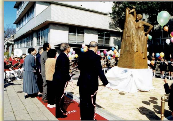
市民募金で設置が実現した「記念碑」(H12除幕式)