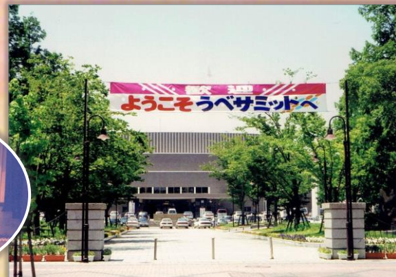
渡辺翁記念会館で開催された「全国サミット」(H13)