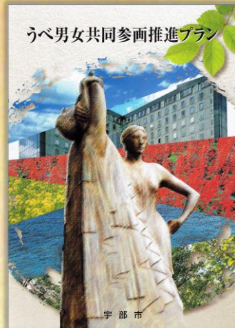
うべ男女共同参画推進プラン (H13)