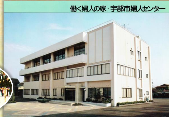
建設当初の「男女共同参画センター・フォーユー」(S57)