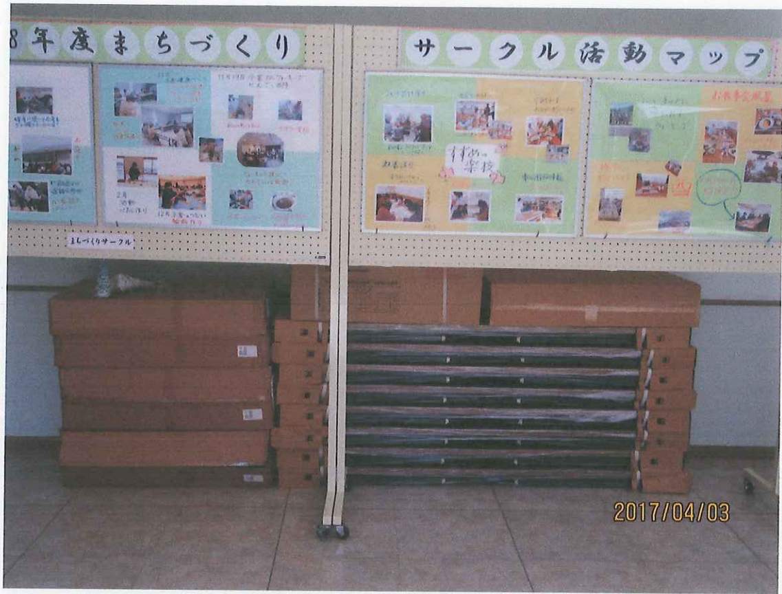
会議用テーブル及び椅子等