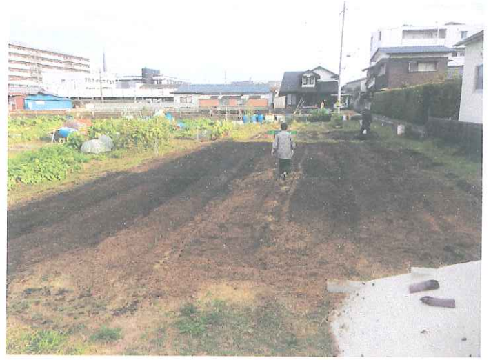
畑の耕しと土壌改良の様子