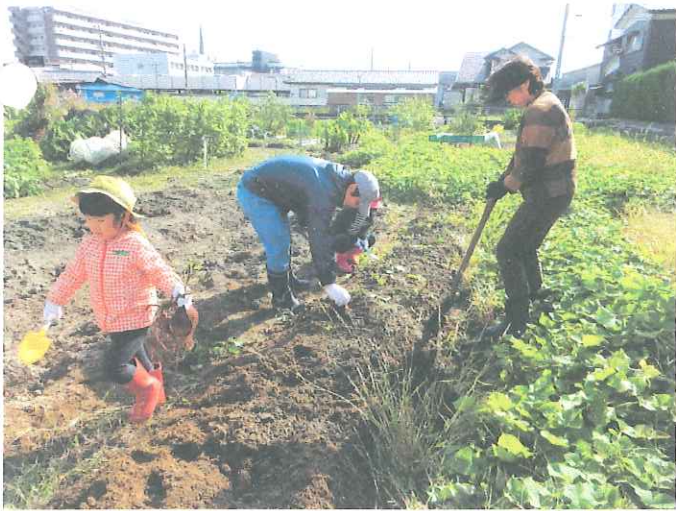
いも掘りの様子 25名参加