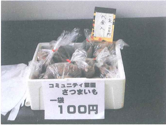
センターでのいもの販売