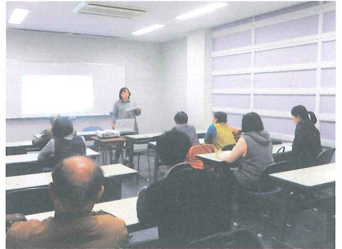
第2回コミュニティ菜園研修会