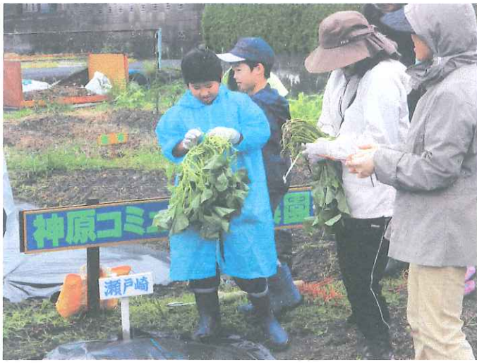
モリモリ恵み体験隊 (いもの苗植え)