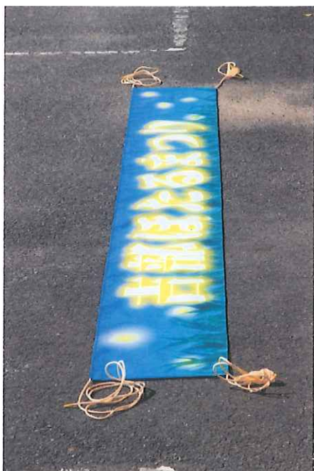
⑪ ほたるまつり横断幕