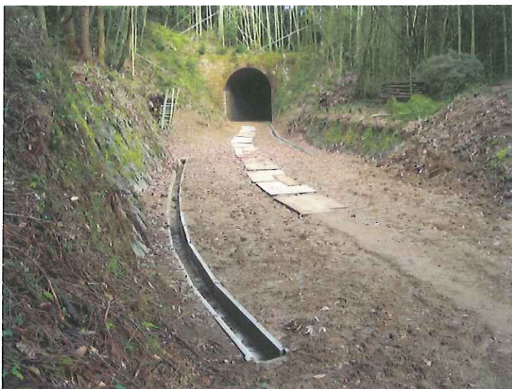
トンネル出口排水路（西側）、造成 中央部パイプ横断