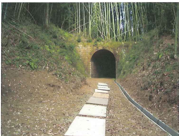
トンネル出口排水路水路（東側）、造成