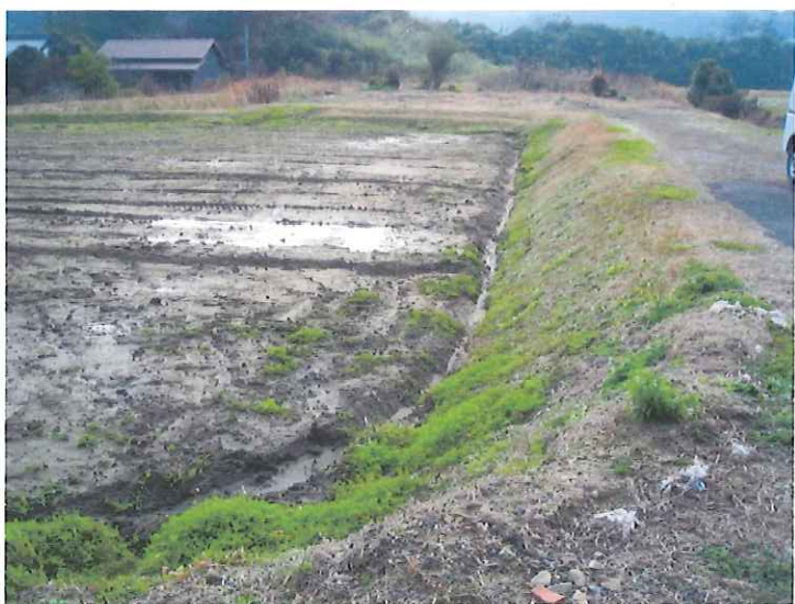
コスモス畑溝掘、造成