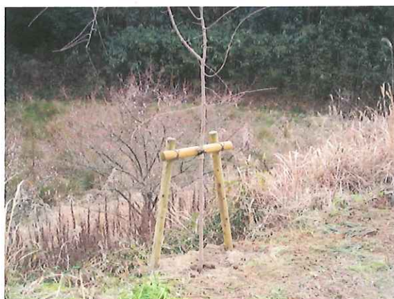
桜植栽 7 本