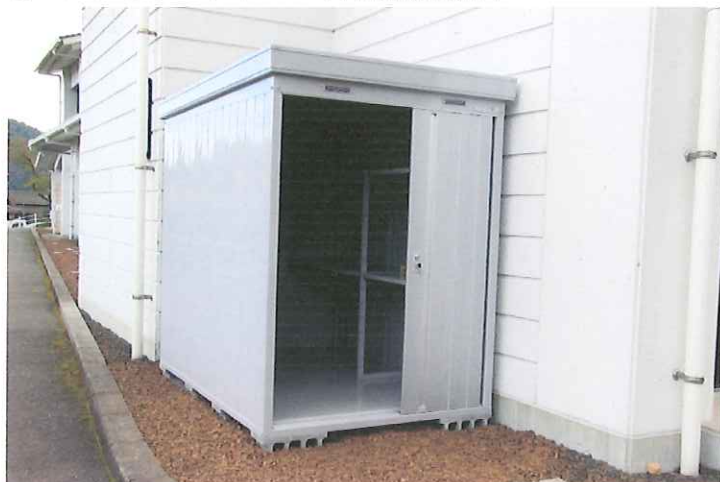
⑩ ほたるまつりイベント用品収納倉庫