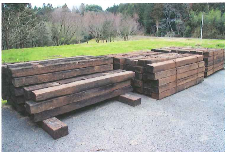
枕木 130 本