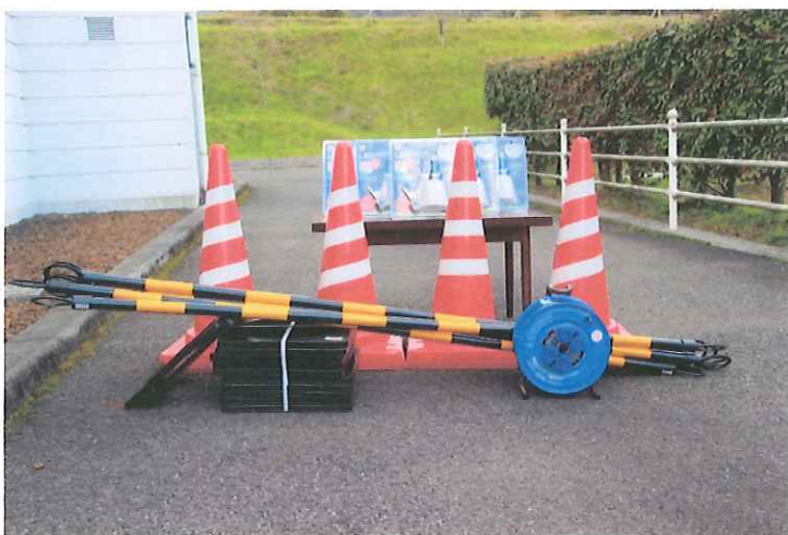
コードリール、コーン、コーンバー