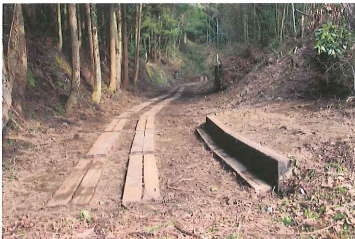
枕木敷設と駅ホーム嵩上げ