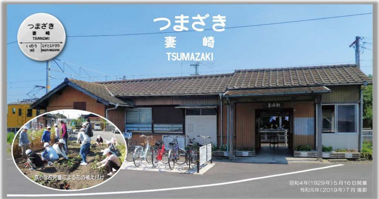
(『妻崎駅 de アート』 パネル写真)