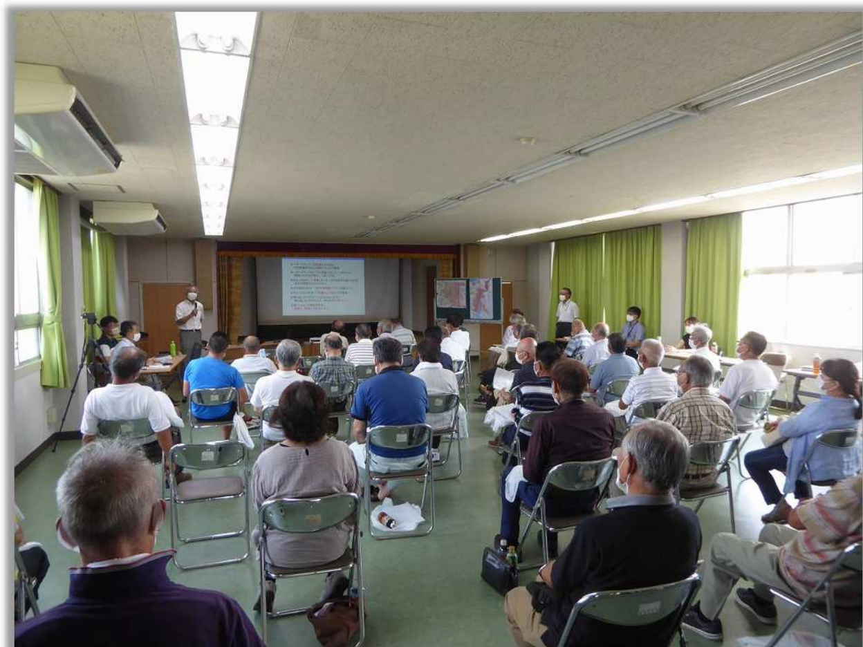
(原地区自主防災会・役員研修会)