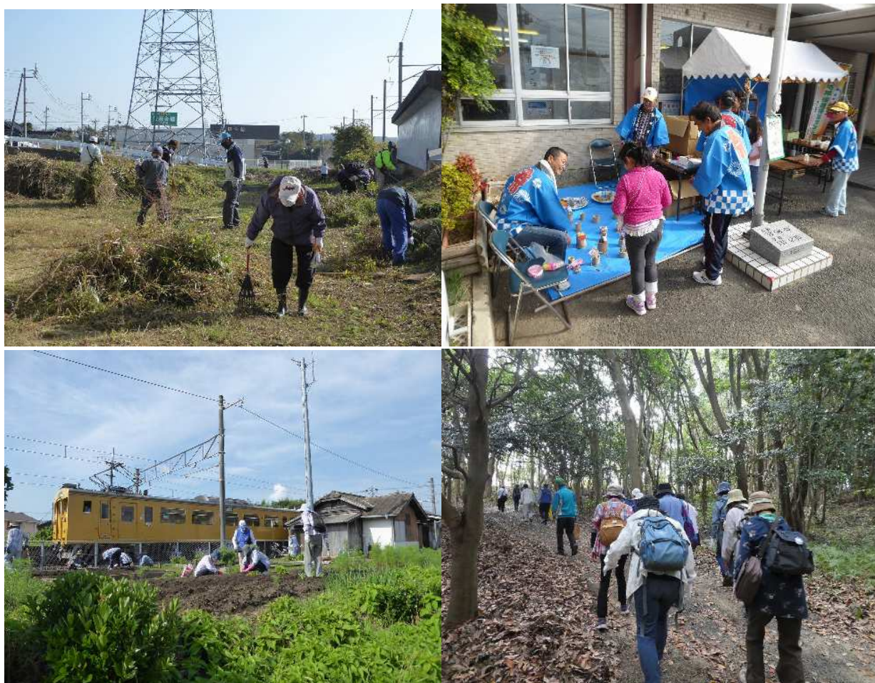
(左上：中川清掃／右上：原ふれあいまつり／左下：妻崎駅花壇づくり／右下：健康ハイキング)