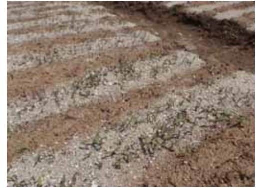
順調に発芽しています